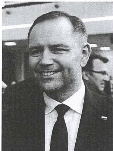
Karol Nawrocki (2025)

Pełne imię i nazwisko Karol Tadeusz Nawrocki