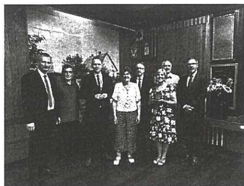
Karol Nawrocki jako dyrektor Muzeum II Wojny Światowej w Gdańsku , w czasie spotkania z Polonią w Nowej Zelandii (2020)

W okresie studiów działał w Samoobronie RP [54] . W latach 2011–2017 był przewodniczącym Rady