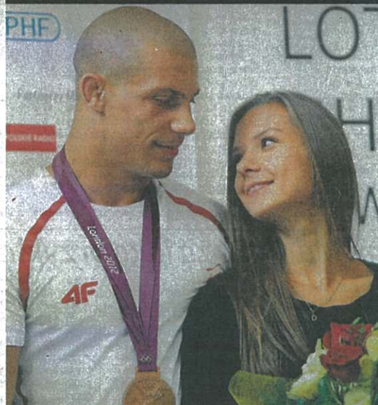
Brązowy medalista w zapasach (na fot. z dziewczyną) wrócił wczoraj do kraju. Na Okęciu witano też innych olimpijczyków. A dziś minister Mucha zdradził plan: co zrobić, żeby za cztery lata Polska zdobyła więcej medali. Str. 20