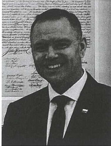
Karol Nawrocki (2025)

Pełne imię i nazwisko Karol Tadeusz Nawrocki