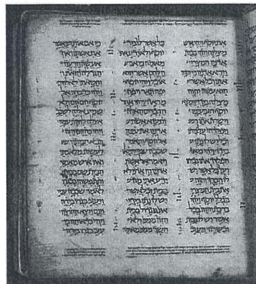
Damaszek Pentateuch, Biblioteka Narodowa Izraela

Tradycja żydowska i chrześcijańska widziała w Mojżeszu autora Pięcioksięgu. Stary Testament przypisuje Mojżeszowi autorstwo określonych ustaw (Wj 24,4; 34,27n [8] ) czy też Księgi Powtórzonego Prawa (Pwt 31.9.22n [9] ). W sposób wyraźny autorstwo całej Tory przypisywane jest Mojżeszowi w I wieku n.e. przez Filona [10] i Józefa Flawiusza [11] . Nowy Testament nazywa Torę imieniem „Mojżesz”, cytuje z „księgi Mojżesza” (Mk 12,26 i in. [12] ) i stwierdza, że Prawo zostało nadane przez Mojżesza (J 1,17 [13] ) [14] .