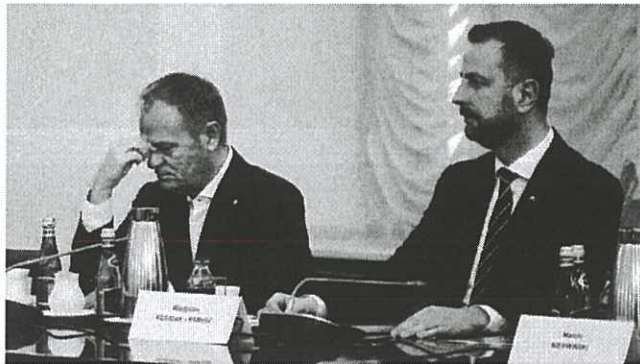
Donald Tusk i Władysław Kosiniak-Kamysz podczas posiedzenia RBN

– Na wszystkie ewentualności trzeba być zawsze