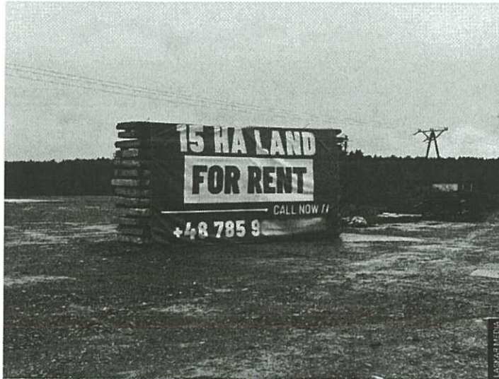
'15 Ha LAND FOR RENT' – jedyny ślad po dawnej bazie. Dosłownie.

Dziękujemy, że przeczytałaś/eś nasz artykuł do końca. Bądź na bieżąco! Obserwuj nas w Wiadomościach Google.