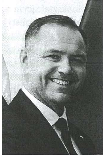
Karol Nawrocki (2025)