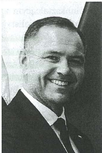
Karol Nawrocki (2025)

Pełne imię i nazwisko Karol Tadeusz Nawrocki