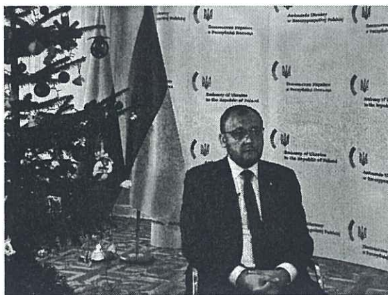
Wasyl Bodnar, ambasador Ukrainy w Polsce.

– To całkowicie dobrowolna jednostka, więc możemy tylko zachęcać do wstępowania do niej. Jestem przekonany, że nasi obywatele, którzy do niej dołączą, będą mieli satysfakcję z dobrego szkolenia – stwierdził dyplomata.