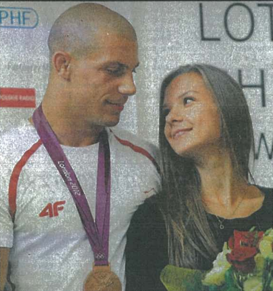
Braźowy medalista w zapasach (na fot. z dziewczyną) wrócił wczoraj do kraju. Na Okęcu witano też innych olimpijczyków. A dziś minister Mucha zdradzi plan: co zrobić, żeby za cztery lata Polska zdobyła więcej medali. Str. 20