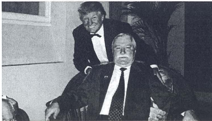
„Hańba dla świata”. Wałęsa ostro o wygranej Trumpa

Według Wałęsy istnieje prawdopodobieństwo, że podczas głosowania doszło do nieprawidłowości.