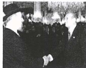
Austria - President Thomas Klestil Secretary of Homeland Security Michael Chertoff

jego życia aż do śmierci, rabin Schneerson pozostał konsekwentny; nie zmienił ani jednej ze swoich opinii. To, czego uczył Schneerson, stało się oficjalną, chasydzką doktryną Lubawiczów. W odniesieniu do nie-Żydów, poglądy rebbe były klarowne: