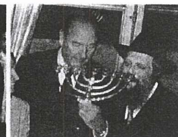
France - President Jacques Chirac

„Różnica między żydowską, a nie-żydowską osobą wynika z po- wszechnej ekspresji «różnicujemy się». A zatem, nie mamy do czynie- nia z przypadkiem głębokiej zmiany, w której dana osoba jest wyłącz- nie na wyższym poziomie. Mamy raczej do czynienia z przypadkiem «różnicowania się» między totalnie odmiennymi gatunkami. Oto, co musi zostać powiedziane o ciele: ciało żydowskiej osoby jest totalnie innej jakości niż ciała [członków] wszystkich narodów świata”.