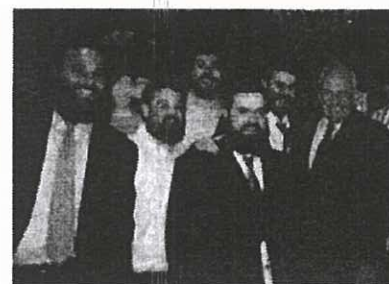
Vice President Dick Cheney ...