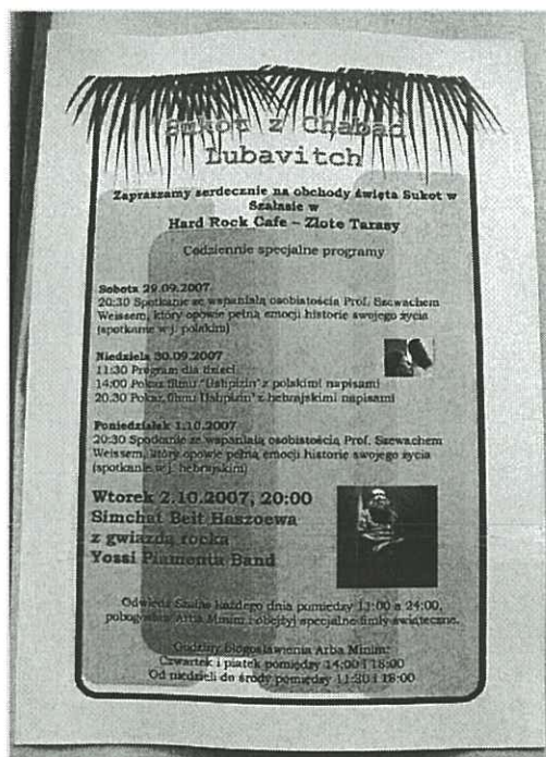
Informacja na temat obchodów święta Sukkot z Chabad-Lubawicz w Hard Rock Cafe w Warszawie – kartka z informacją