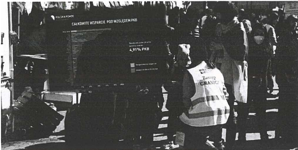
Przeście graniczne po wybuchu pełnoskalowej wojny w Ukrainie i wykres podsumowujący wsparcie różnych krajów

Prawie 5 proc. rocznej produkcji w gospodarce kosztowała Polskę pomoc Ukrainie na kilku różnych polach. Pomoc militarną można szacować na 14 mld zł, koszty utrzymania uchodźców wojennych objętych ochroną tymczasową – na 7,4 mld zł, a świadczenia opieki zdrowotnej – na 3,3 mld zł.