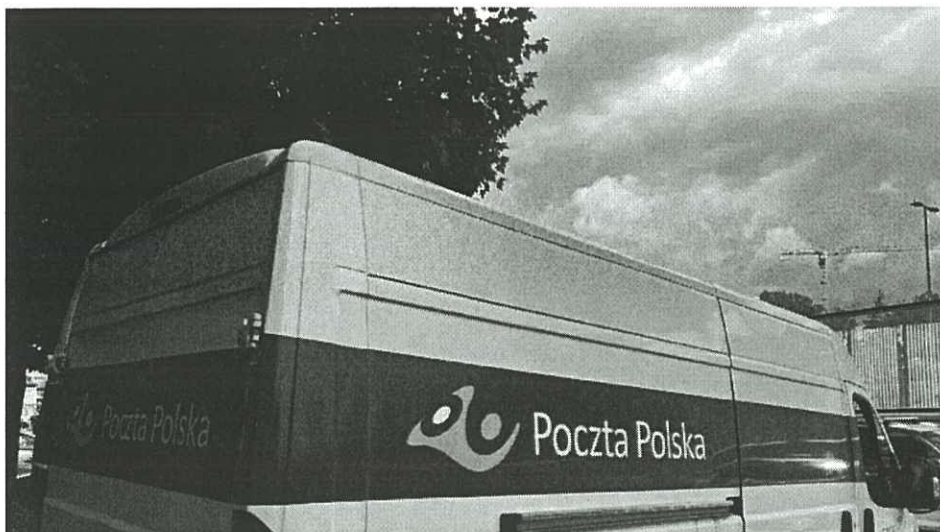
Będzie strajk w Poczcie Polskiej?

Związkowcy z Poczty Polskiej grożą organizacją strajku, jeśli pracownicy nie otrzymają podwyżek w wysokości 800 zł. -Oczywiście chcielibyśmy, żeby najbardziej w trąbę dostał rząd - powiedział w rozmowie z RMF FM Bogumił Nowicki z "Solidarności".