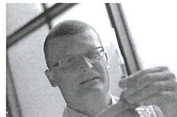
Filip Klimaszewski/Agencja Gazeta

Druga sprawa to umiejętność, której nie da się nauczyć, chyba mam to po rodzicach, mianowicie żyłka edukacyjna. Szukam prostych porównań, staram się zobrazować to, co mówię, bo nie ma nic gorszego niż mówienie o medycynie bez zobrazowania fachowych zwrotów. Sam skrót RNA nic nie znaczy dla 95 proc. Polaków. Trzeba ten skrót rozwinąć, wytłumaczyć i