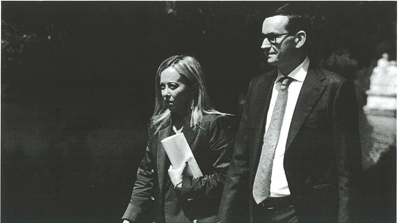
Mateusz Morawiecki, Giorgia Meloni.

Premier Włoch Giorgia Meloni ogłosiła w niedzielę w Rzymie, że zrezygnuje z dalszego przywództwa w partii Europejskich Konserwatystów i Reformatorów (EKR) i zapowiedziała udzielenie poparcia byłemu polskiemu premierowi Mateuszowi Morawieckiemu.